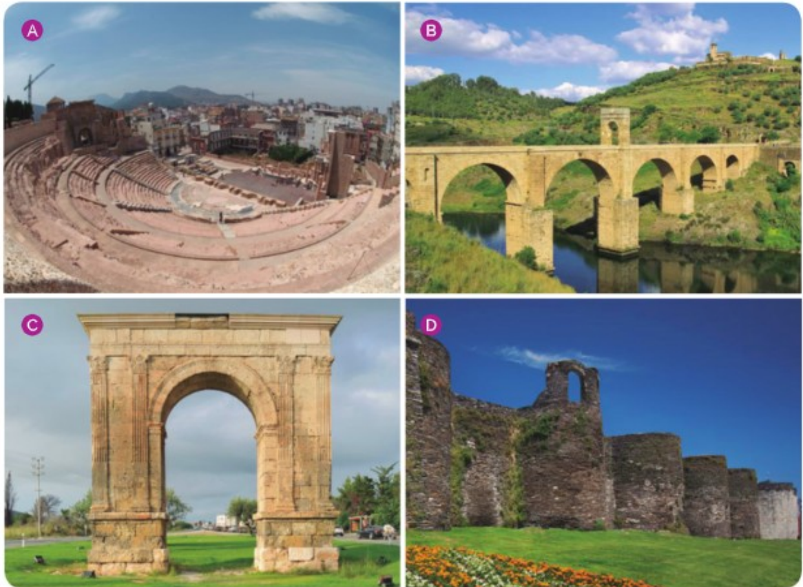
30. Construcciones hispanorromanas. Teatro de Cartagena. (A) Puente de Alcántara (Cáceres). (B) Arco de Bará (Tarragona). (C) Murallas de Lugo. (D)