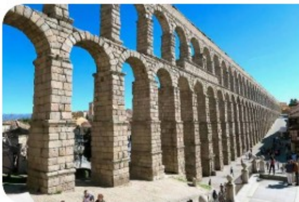
ACUEDUCTO DE SEGOVIA