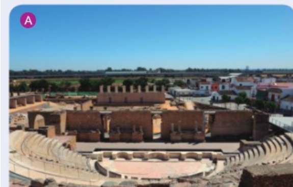
33. Teatro (A) y anfiteatro romanos (B) de Itálica.

Las termas mayores , también de grandes proporciones en relación con el tamaño de Itálica, constaban de distintas salas de baños y una gran palestra porticada.