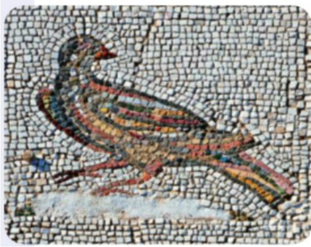
Decoración con mosaicos