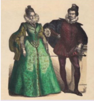
11. Pareja de la alta nobleza.