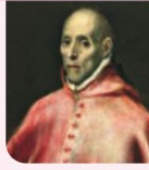
12. Miembro del alto clero.